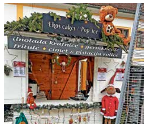
Ekos Cakes/Pop Ice kućica na Korzu