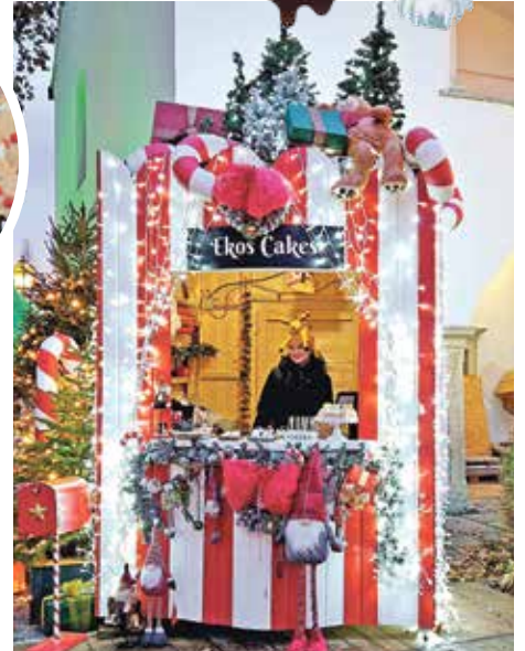
Ekos Cakes adventska kućica u Čarobnom gradu u dvorištu palače Šermage