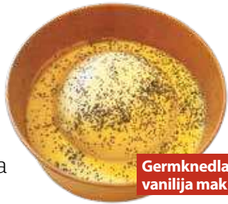
Germkneda vanilija mak