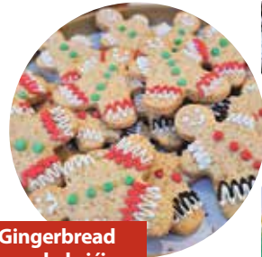
Gingerbread man keksići