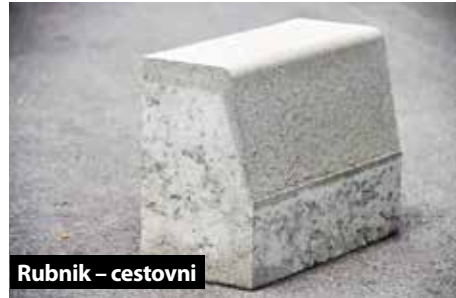
Rubnik – cestovni