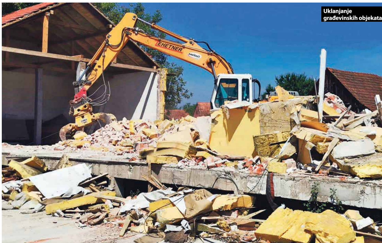
Uklanjanje građevinskih objekata

Učinkovitim gospodarenjem i obradom građevinskog otpada postiže se smanjenje potrebe iskorištavanja prirodnih resursa te ekološki odgovorno djelovanje u građevinarstvu. U Reciklažnom dvorištu Mišić nastaju reciklirani agregati kao što su drobljeni asfalt, beton i opeka, koji udovoljavaju važećim propisima te su ispitani