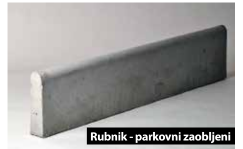
Rubnik - parkovni zaobljeni