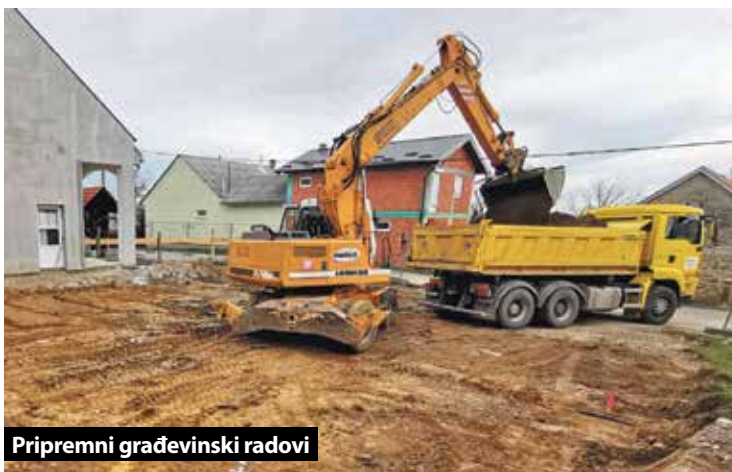
Pripremni građevinski radovi