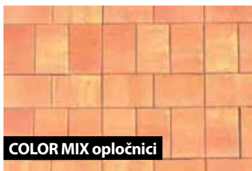
COLOR MIX opločnici

Budući da tvrtka Zagorje-Tehnobeton d.d. kontinuirano radi na razvoju novih proizvoda kako bi u potpunosti zadovoljili potrebe kupaca i investitora, u svojem proizvodnom i prodajnom asortimanu ima novi proizvod, betonske opločnike COLOR MIX u kombinacijama boja smeđa – oker, crno – bijela i crveno – žuta,