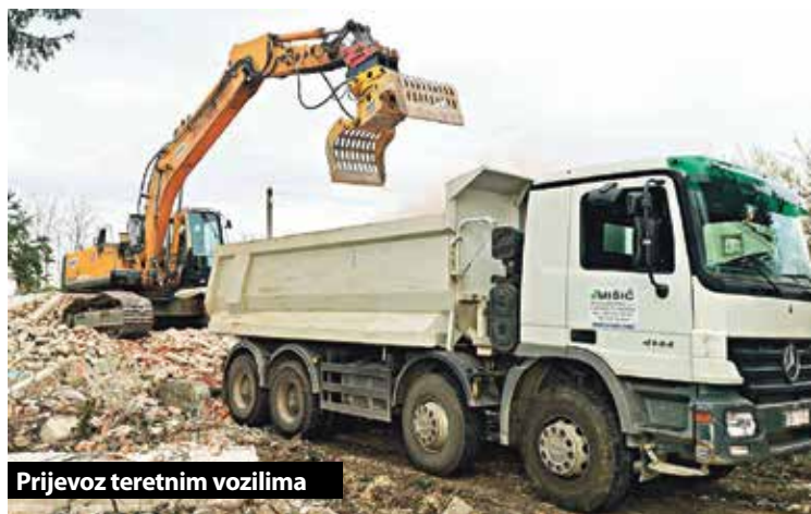
Prijevoz teretnim vozilima