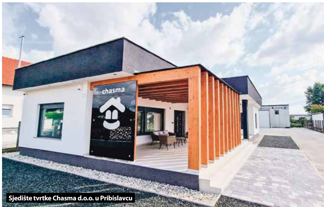
Sjedište tvrtke Chasma d.o.o. u Pribislavcu