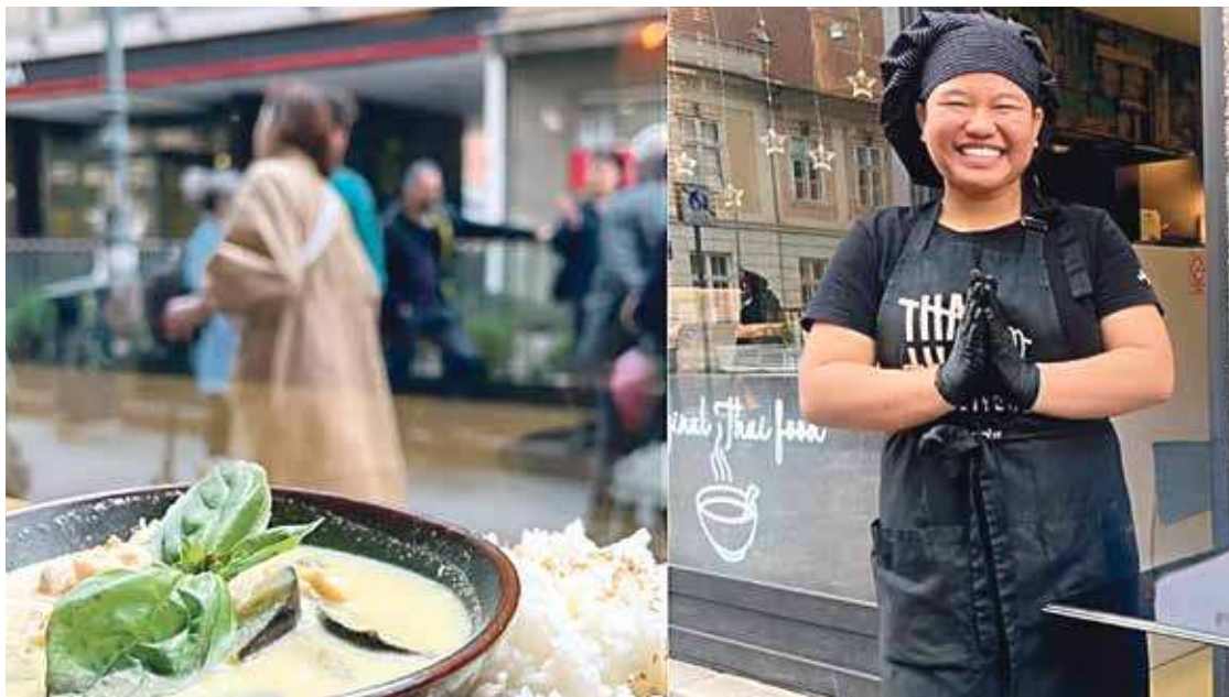
Tradicionalna jela Tajlanda pripremaju originalne tajlandske kuharice

Špancirerima će predstaviti svoj Tom Yum juneći burger, koji donosi lagan i osvježavajući, karakterističan tajlandski okus, zatim Pulled Pork sendvič, koji osvaja kombinacijom slatkoće chutneyja i azijske coleslaw salate s mangom i papajom. U ponudi će biti i svoje najprodavanije jelo, izdašni Pad Thai s prženim rezancima, koje savršeno uravnotežuje pikantne okuse s daškom slatkoće. Egzotičnoj paleti delicija pridružuje se i originalni tajlandski desert Mango Sticky Rice tako da će i slatkoljupci doći na svoje!